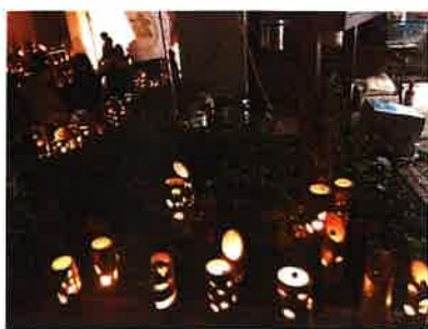
竹キャンドルは癒されました