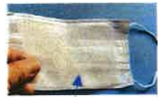
マスク用とりかえシート

当会では岡山県医師会透析医部会より紹介いただきました、マスク用とりかえシートを会員全員に配布いたしますのでご使用ください。