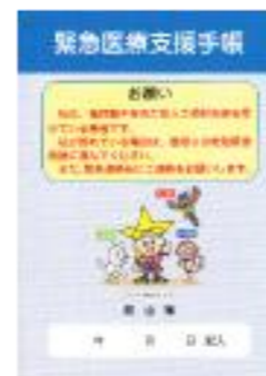
緊急医療支援手帳